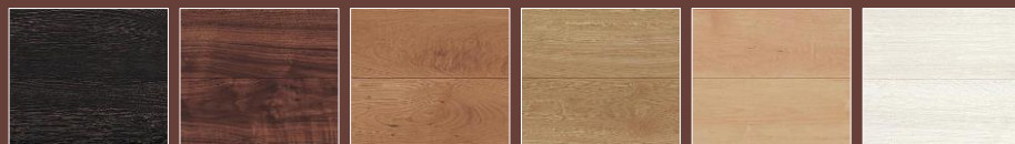
■ スモークオーク柄 ■ ウォールナット柄 ■ チェリー柄 ■ オーク柄 ■ メープル柄 ■ ホワイトオーク柄

「フィットボード」は基材の木質部分に建築廃材などをリサイクルした木質材料を100%（接着剤は除く）使用、地球環境に配慮した新素材です。